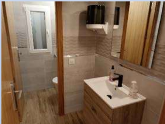
ADECUACION INTEGRAL SALA DEPOSITOS