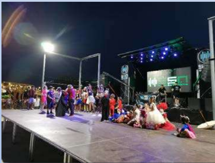
CONCURSO DE DISFRACES