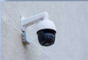
APP PAGO Y RESERVA DE PISTAS