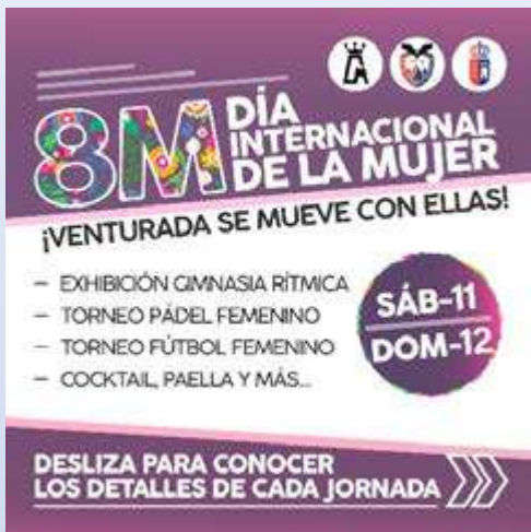
DIA DE LA MUJER