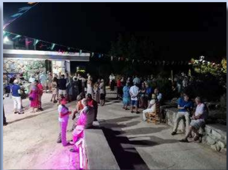
FIESTA DE LOS MAYORES